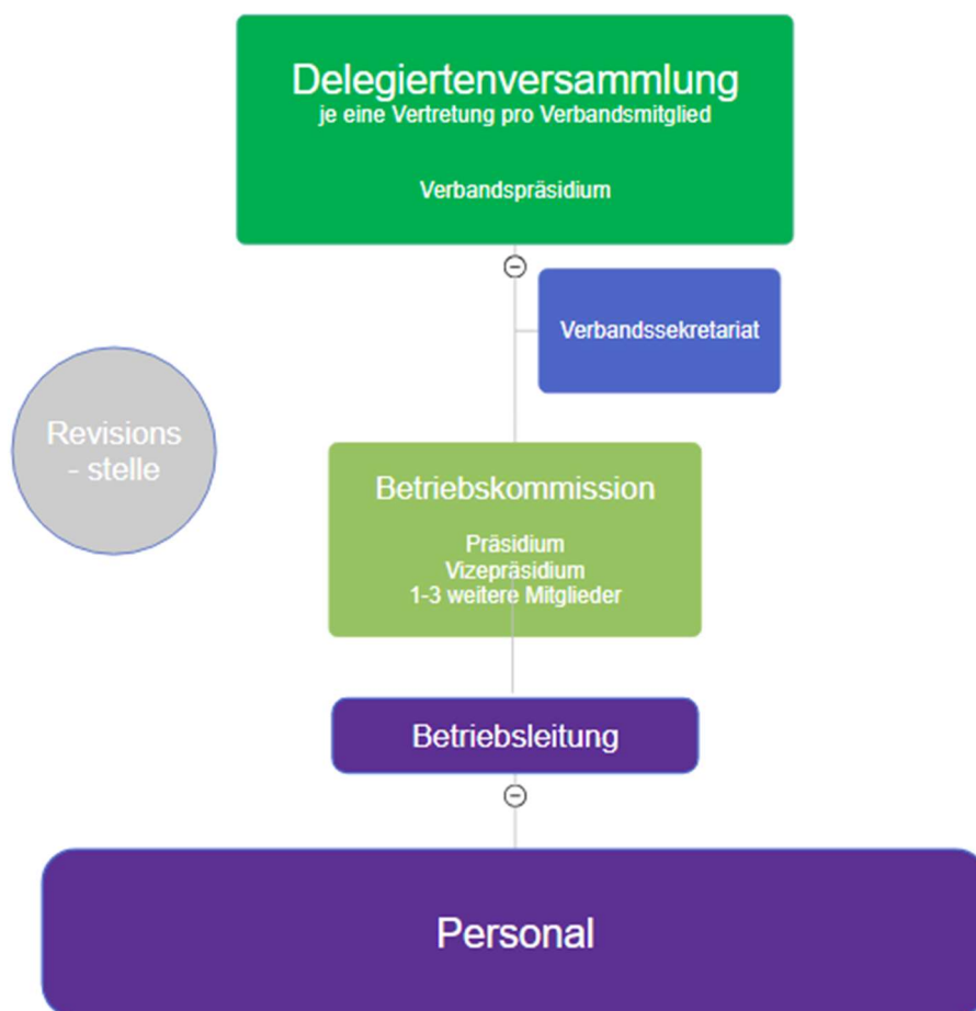
Abb. 1: Darstellung der neuen Verbandsstruktur

Die Organisationsstruktur bzw. die Organe des neuen «Abwasserverbands Röti» ergeben sich aus der nachfolgenden Grafik. Es handelt sich dabei um eine schematische Darstellung der Organisation innerhalb des Verbandes.