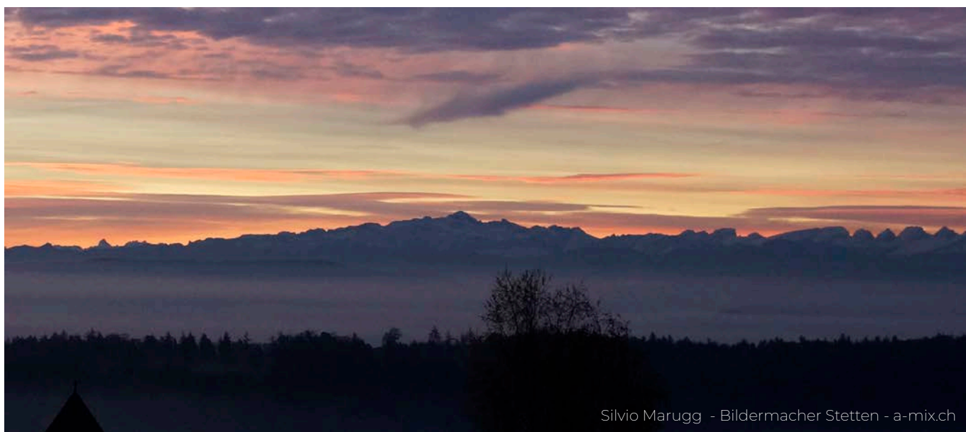
Silvio Marugg - Bildermacher Stetten - a-mix.ch

GEMEINDE-INFO DER GEMEINDE STETTEN WWW.STETTEN.CH NR. 4/2019