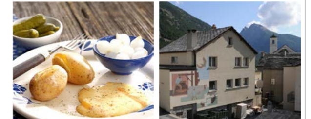
Sennerie Simplon Dorf

Termin: Freitag, 25. Oktober 2019; ab 19:00 Uhr Anmeldung erforderlich; Durchführung bei mind. 15 Personen.